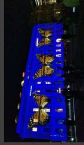
Festival of Lights 2021