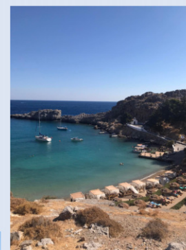
St. Paul's Bay